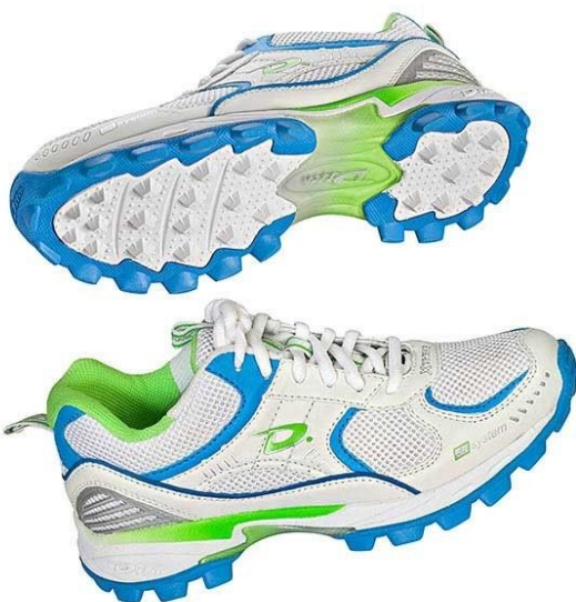
Beispiel für gute Feldschuhe

Ohne guten Stand im Spiel hat man oft das Nachsehen im Zweikampf mit dem Gegenspieler und weniger Spaß. Idealerweise schützen die Schuhe auch die Füße bei zu hartem Kontakt mit dem Hockeyball.