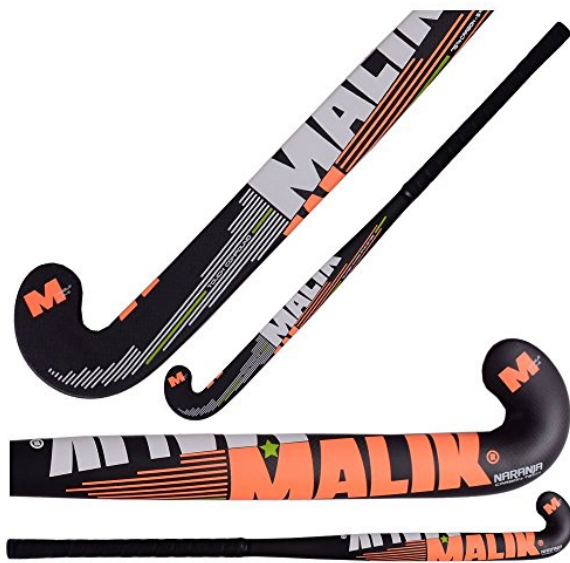
Beispiel für Feldschläger aus Kunststoff

Feld- und Hallenhockey unterscheiden sich in den Details relativ voneinander. Zum einen beeinflusst die unterschiedliche Spielfeldgröße und der unterschiedliche Untergrund das Spiel. Zum anderen unterscheiden sich die Spielregeln von beiden Hockeytypen. Beim Feldhockey muss der kleine Plastikball gelegentlich über bis zu 100m zum Mitspieler gepasst werden. Beim Hallenhockey sind die Distanzen nur halb so groß, dafür ist das Spiel sehr viel agiler mit mehr Richtungsänderungen und mehr Fokus auf hohem Spieltempo. Feldschläger sind etwas schwerer und stabiler um die größeren Kräfte besser aushalten zu können. Hallenschläger sind leichter und können damit schneller, handlicher bewegt werden.