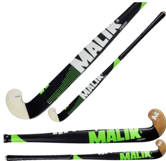
Beispiel für Hallenschläger aus Holz