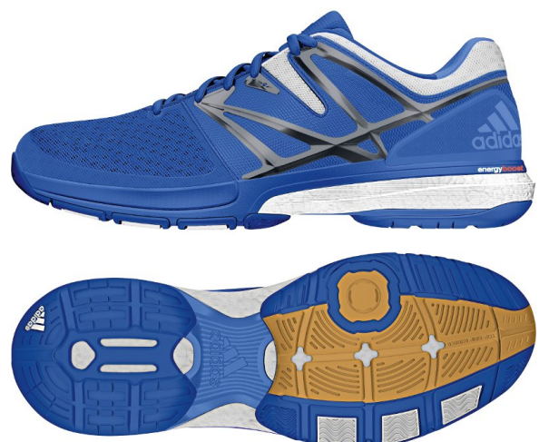
Beispiel für gute Hallenschuhe