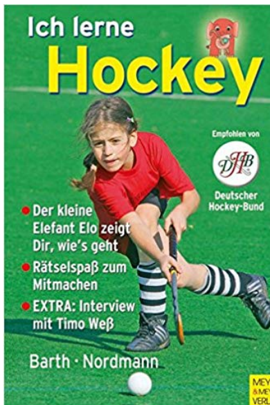
Ich lerne Hockey Barth/Nordmann ca.15€