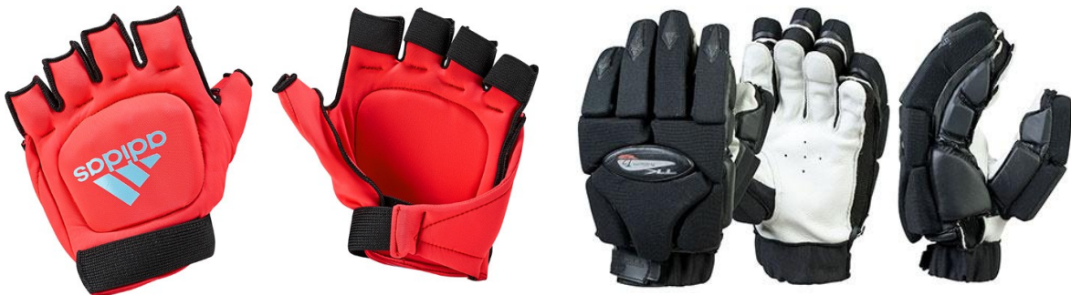
Beispiel für Feldhandschuh

Beim Hallenhockey ist es sehr oft erforderlich den Schläger über die ganze Länge auf den Boden zu legen, um den Ball zu ergattern. Deshalb wird hier mit einem komplexen Handschutz gespielt, der die Hand vollständig schützt. Auf dem Feld ist die Körperhaltung aufrechter, sodass ein weniger umfangreicher Schutz ausreichend ist.